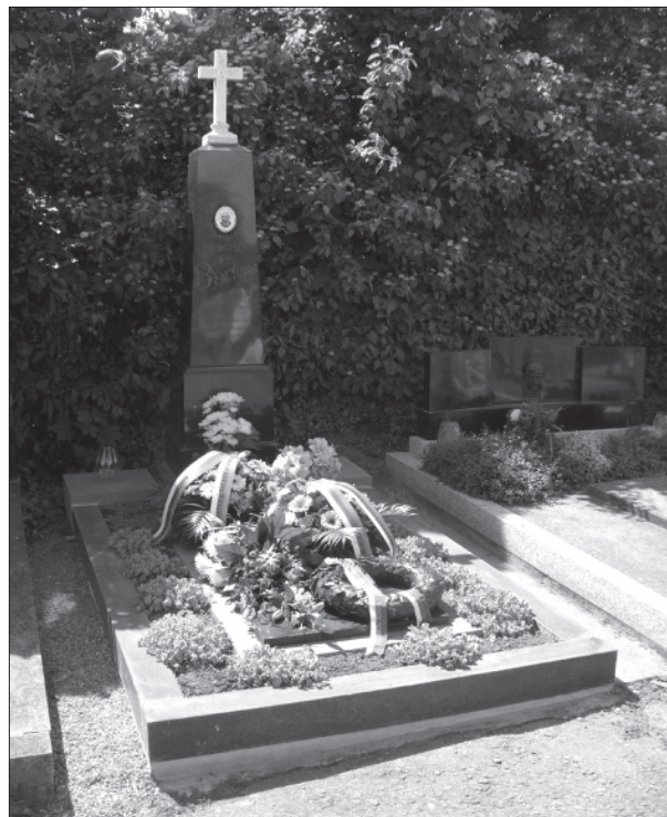
Mladcová, hrob Františka Bartoše.