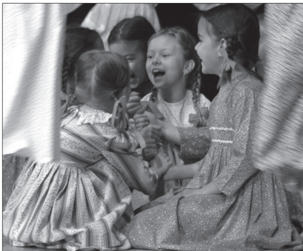
Hradištánek - pořad Naše děti.

z děl L. Janáčka, B. Martinů a V. Nováka a z odkazu F. Bartoše.