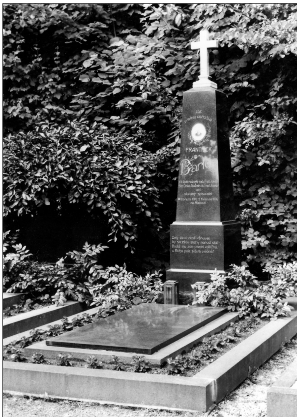
Mladcová, hrob Františka Bartoše.