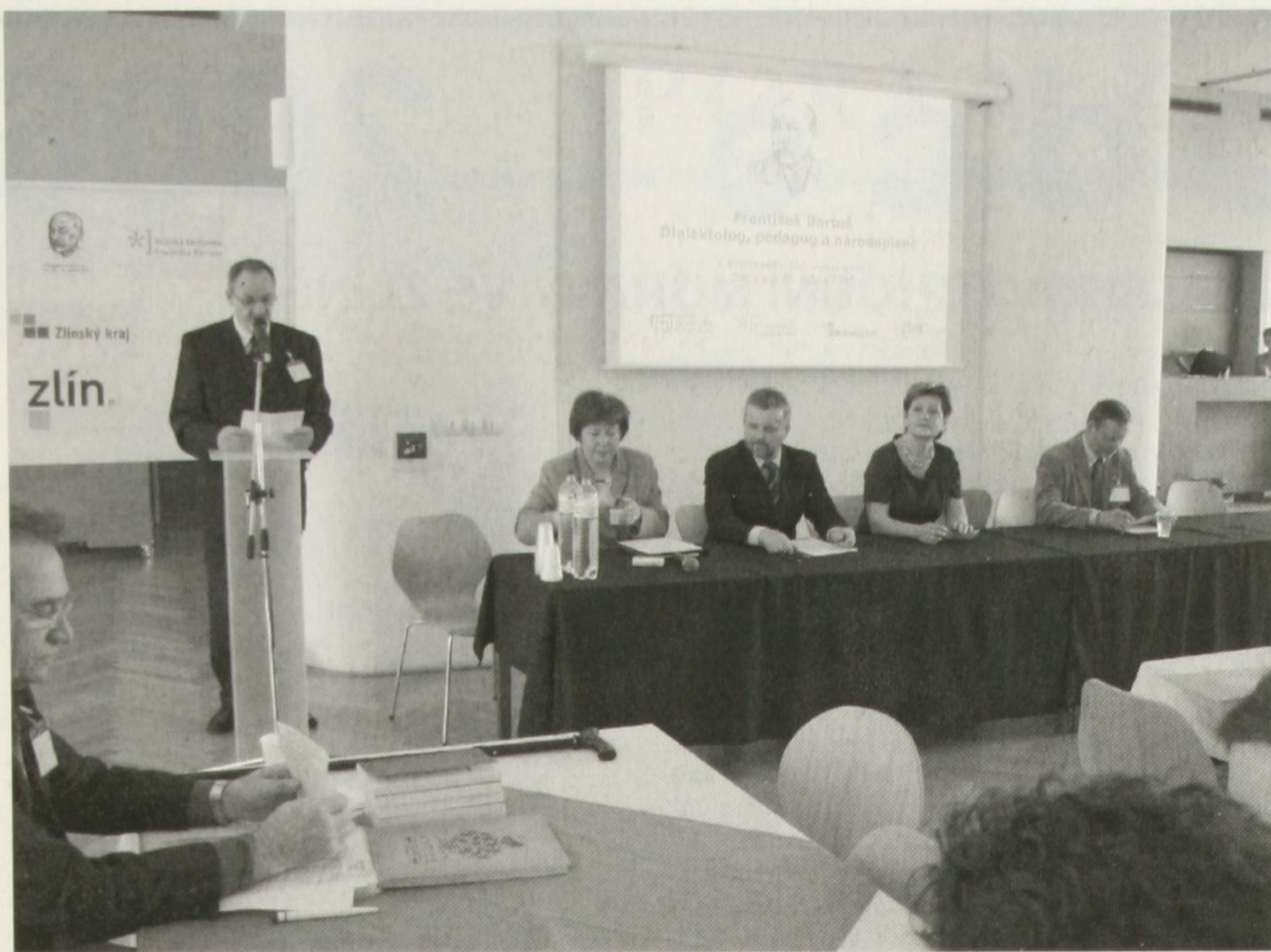
Konferenci pořádanou Muzeem jihovýchodní Moravy a Knihovnou Františka Bartoše svou účastí zařadili představitelé kraje, města, odborných a vědeckých institucí

Svou Dialektologii moravskou , spisem o moravských nářečích, získal František Bartoš proslulost i ve vědeckém světě slovanském. Tomuto dílu byla udělena cena Akademie nauk v Petrohradě, vysoce ji hodnotili Fr. Miklosiċ a Jan Gebauer. Ten prohlásil, že nezná v české gramatické literatuře tak obsáhlé a tak pravdivé dílo, jako je Dialektologie Františka Bartoše .