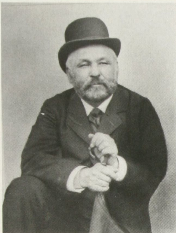
František Bartoš v době svého působení v Brně

Památku Františka Bartoše oslavujeme ne na koních, ne tancem, ne pitkami. Nejdůstojnější oslava spisovatele jest, rozmnožíš-li jeho dílo, aby se stalo přístupné a užitečné všem lidem. Takto chceme my oslavit tohoto syna našeho kraje.